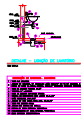
PROJETO ESGOTO esc.1/50